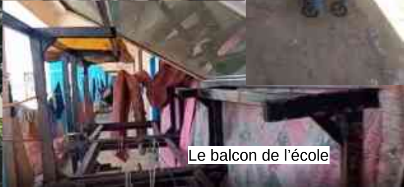
Le balcon de l'école