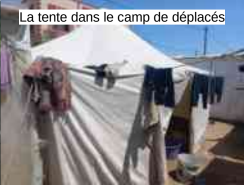
La tente dans le camp de déplacés