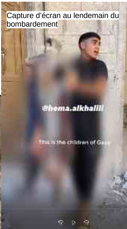
Photo recue le 10/08/2024 Il s'agit de parties du corps des gens écrit-elle

هل كل القوانين الدولية لم تستطع حمايتنا من هذا الاجرام ؟ ولكنني تأكدت في هذه المرة بأن القوانين لم تشمل غزة ، لأن هذا العالم أصم لا يسمع ولا يتكلم ، فربما إعتاد العالم هذه المشاهد فأصبح خبر الموت والاشلاء خيرا عابرا وروتين يومي ، لقد إرتكب هذا الجيش النازي الكثير من المجازر بحق المدنيون في غزة ، ولكن صمت العالم هو الذي شجعه على مواصلة جرائمه ، فأصبح الدم . الفلسطيني رخيص وليس له قيمة