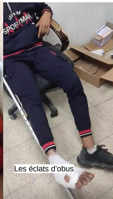
Les éclats d'obus