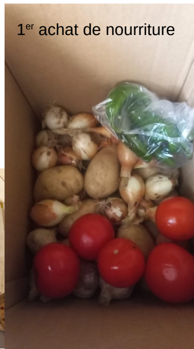
1 er achat de nourriture