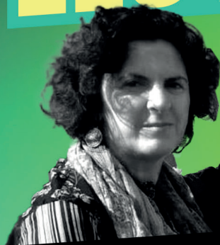
LANA SADEO FORUM PALESTINE CITOYENNETÉ