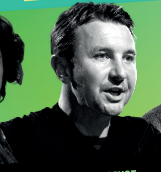
OLIVIER BESANCENOT NPA