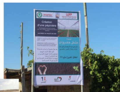
2021 : permettre le recrutement d'un ingénieur agronome pour conseiller et soutenir les agriculteurs de la bande de Gaza