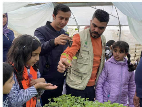
Visite scolaire à la pépinière solidaire : les graines de l'avenir

Pénurie d'eau et d'électricité, champs empoisonnés par des herbicides, blocus asphyxiant les marchés, puits bombardés, balles déchirant les serres, récoltes brûlées... inlassablement les paysans remettent en culture : la terre palestinienne, ils la défendent en la cultivant.