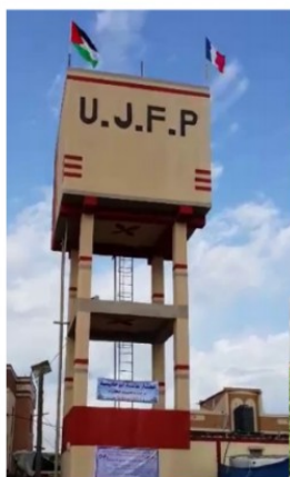
2016 : participer à l'indispensable accès à l'eau. Le château d'eau de Khuza'a alimente par étape une centaine d'exploitations agricoles

Il est très difficile pour les Gazaouis de sortir de leur enfermement pour venir parler directement. Venez nombreux échanger avec lui, car la solidarité internationale est nécessaire et efficace !