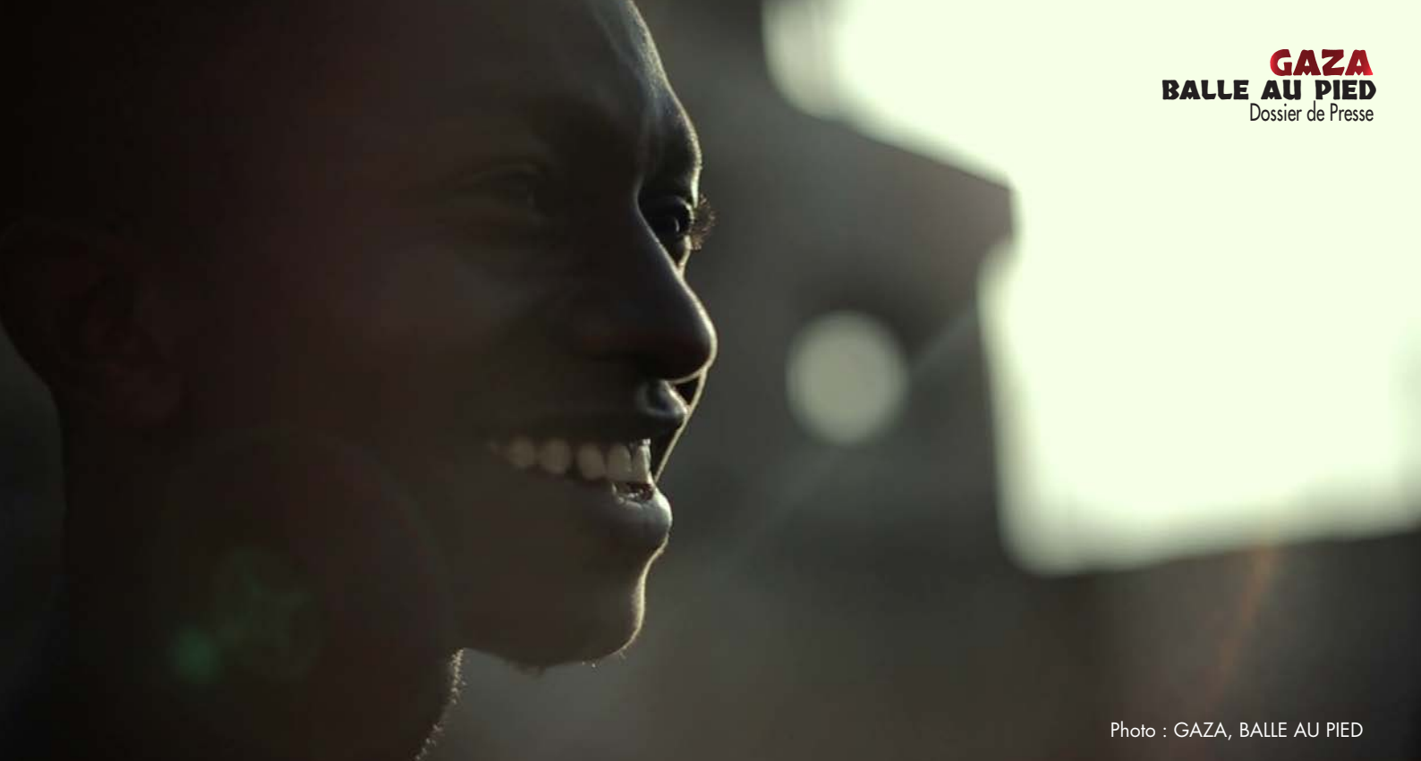
Photo : GAZA, BALLE AU PIED