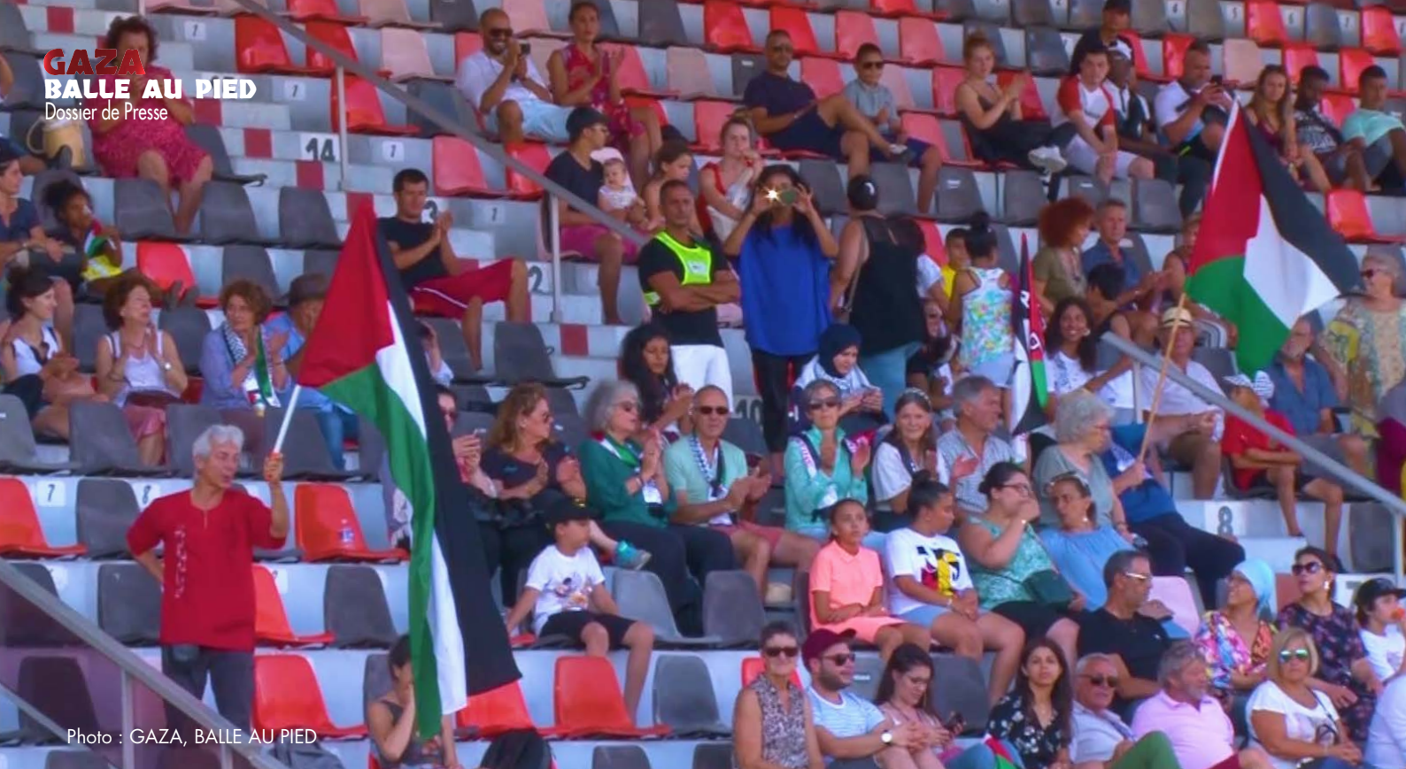
Photo : GAZA, BALLE AU PIED