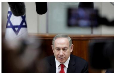
Benjamin Netanyahu, premier ministre israélien

PAR LÉNAÏG BREDOUX ARTICLE PUBLIÉ LE SAMEDI 15 JUILLET 2017