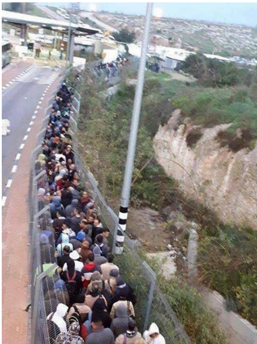
Photo prise hier (NDLT 15 mars 2017) au check point militaire de Beit Sira à l'ouest de Ramallah.

Des travailleurs palestiniens se rendant à leur travail, mais chaque jour ils sont forcés de passer entre de telles lignes de barrières en plus de toutes les autres des forces sionistes d'occupation. Même les animaux dans un monde civilisé ne sont pas traités ainsi, mais ces travailleurs n'ont pas le choix, ils ont besoin de nourrir leurs familles, ils sont obligés de travailler. Bon, si ce n'est pas l'apartheid, comment ça s'appelle ???