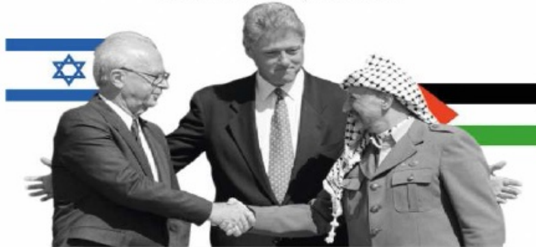
Yitzhak Rabin, Premier ministre israélien, Bill Clinton, Président des États-Unis et Yasser Arafat, Président du comité exécutif de l'OLP (Organisation de Libération de la Palestine)

Accords d'Oslo : 13 septembre 1993 à Washington. Objectif : poser les premiers jalons d'une résolution du conflit israélo-palestinien .