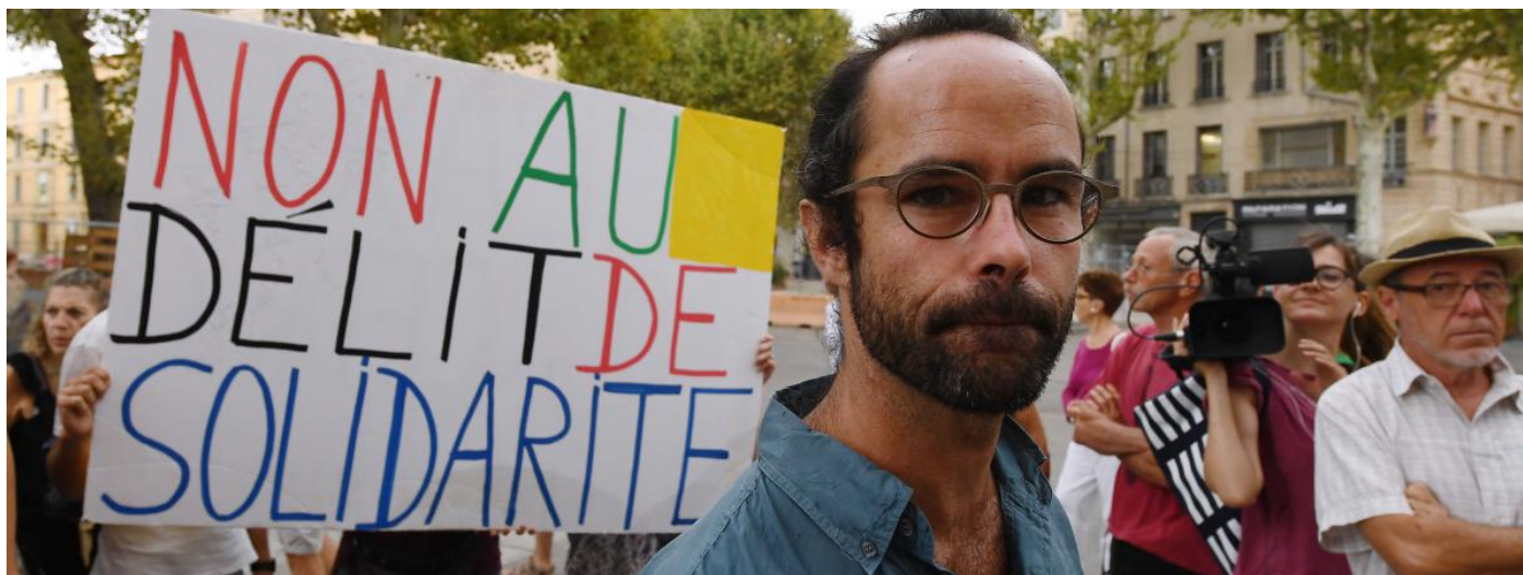
L'agriculteur militant Cédric Herrou devant la cour d'appel d'Aix-en-Provence (Bouches-du-Rhône), le 8 août 2017.

Ce matin, mardi 12 septembre, Cédric Herrou est convoqué à la gendarmerie, sans connaître l'objet de cette convocation. Il apprendra alors qu'il est l'objet d'une plainte pour « violences aggravées et séquestration » de la part d'un personnage présentement en maison d'arrêt, après condamnation à 8 mois de prison ferme par le tribunal correctionnel de Nice en tant que passeur professionnel, étranger lui-même en situation irrégulière.